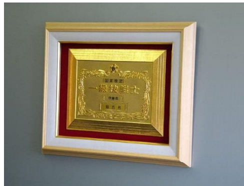
②1級楯ガラス額入り ¥41,250 ガラス額外木枠・別珍張り (縦44cm 横53cm 厚さ5cm)