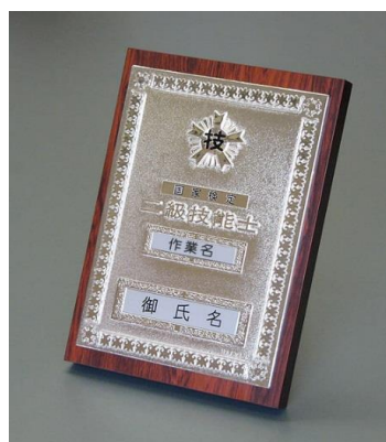
⑩2級机上用 ¥19,800 ダイカスト仕上(純銀メッキ) (縦24cm 横16.5cm 厚さ2cm)