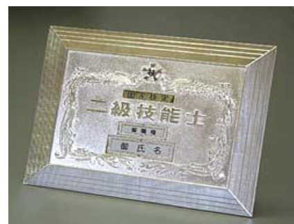
⑧2級店頭用楯 ¥24,750 ダイカスト仕上(純銀メッキ) (縦27cm 横35cm 厚さ1.5cm)