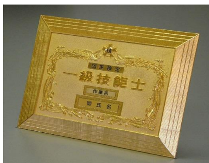
⑥1級店頭用楯 ¥27,500 ダイカスト仕上(24KGP) (縦27cm 横35cm 厚さ1.5cm)