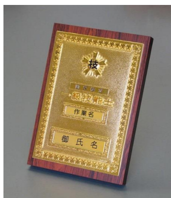
⑨1級机上用 ¥20,900 ダイカスト仕上(24KGP) (縦24cm 横16.5cm 厚さ2cm)