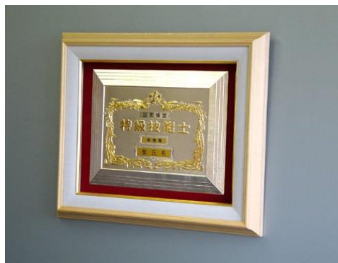
①特級楯ガラス額入り ¥44,550 ガラス額外木枠・別珍張り (縦44cm 横53cm 厚さ5cm)